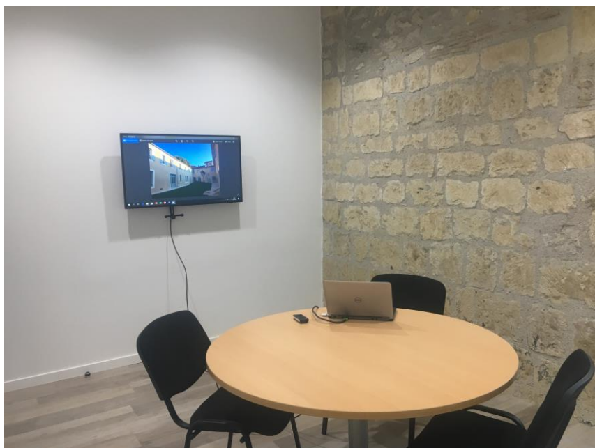
Petite salle de réunion