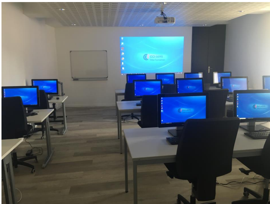
Salle de formation informatique 15 postes