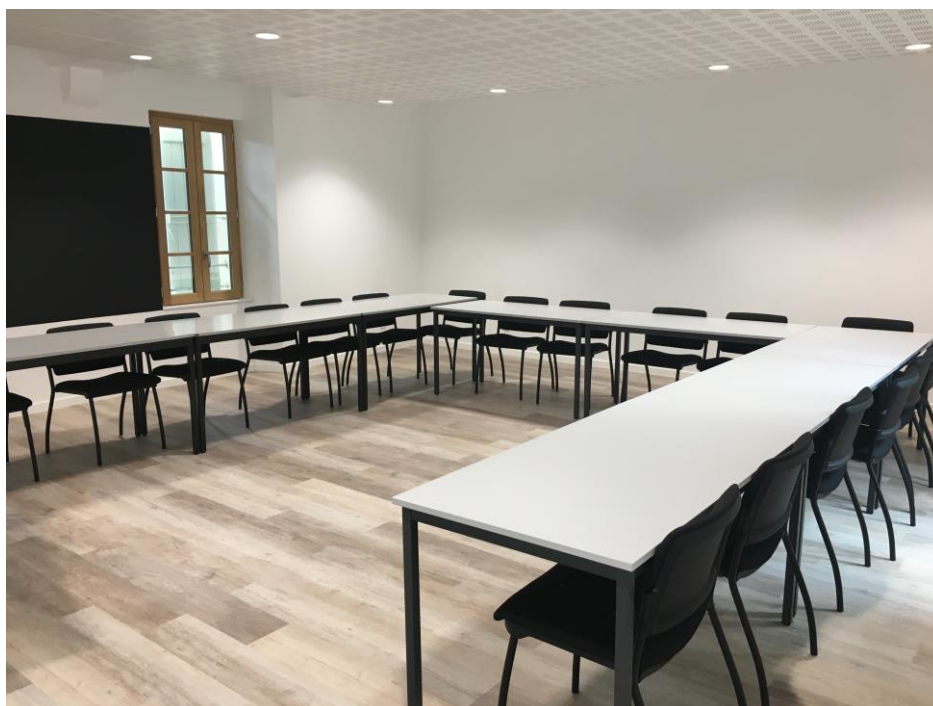
Salle de formation classique