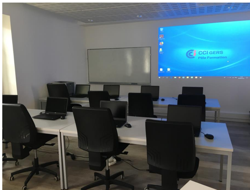
Salle de formation informatique 10 postes